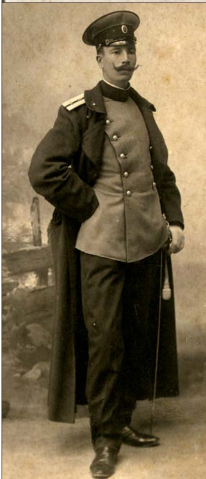
Коњичка свечана униформа