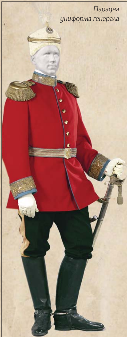
Парадна униформа генерала