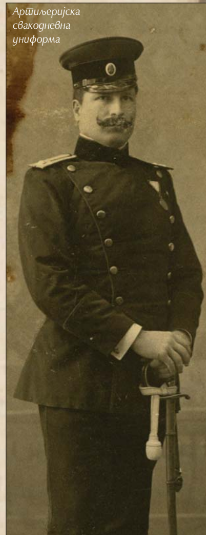
Артиљеријска свакодневна униформа

Шапка је од мундирске чоје, са бортом од кадифе боје јаке на мундиру, ширине 50–55 mm. По горњој ивици борта а и испод њега је испуска од чоје од које је и шапка. Шапка за војводе и генерале је од гаранс чоје, а борт и горња испуска од отвореноплаве кадифе, док су средња и доња испуска од гаранс чоје. Пречник горњег дела шапке шири је од доњег дела за 70–85 mm, а има унаоколо испуску од чоје боје јаке на мундиру (код артиљерије црвено). Сунцобран је црн, лакован, повијен на ниже, а доња ивица је пресована. Подбрадник је од црне лаковане коже ши-