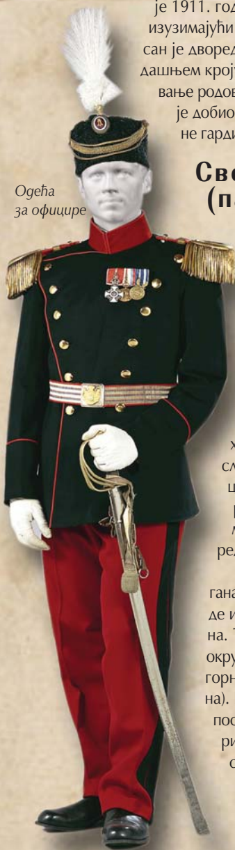
Одећа за официре

Нова измена у парадној униформи официра урађена је 1911. године. За све родове војске, изузимајући коњицу и генерале, прописан је дворедни црни мундир – по дотадашњем кроју, чиме је укинута разликовање родова по боји мундира, а калпак је добио већу висину и гајтане сличне гардијским.