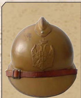
Шлем француског типа „адриан“ М 1915

закључити да је одређена количина ових униформи такође била у употреби.