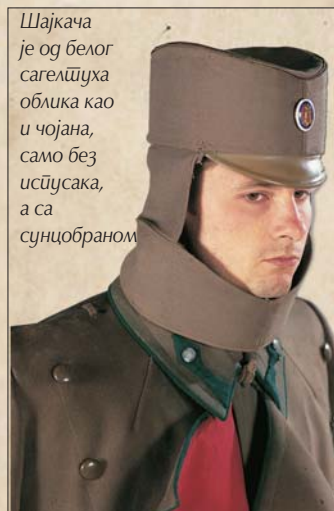
Шајкача је од белог сагелџуха облика као и чојана, само без исџусака, а са сунцобраном

Ађутанти и ордонанс официри на двору Његовог величанства краља носе униформу свога рода војске или струке са следећим разликама. На свим нараменицама (еполетама и еполетушкама) изнад звездица носе краљев монограм, кован златан на сребрним, а сребрни на златним нараменицама. Теме калпака је код ађутаната од гаранс чоје, а код ордонанс официра од беле чоје. Шапка је код ађутаната од гаранс, а код ордонанс официра од беле чоје. Ројте (акселбендере) носе на десном рамену, редовно на мундиру, а у рату и на маневрима и на блузи. Трутни ађутанти такође носе акселбендере увек на блузи и на мундиру. Боја акселбендера је сребрна или златна у зависности од боје нараменица (еполете и еполетушке).