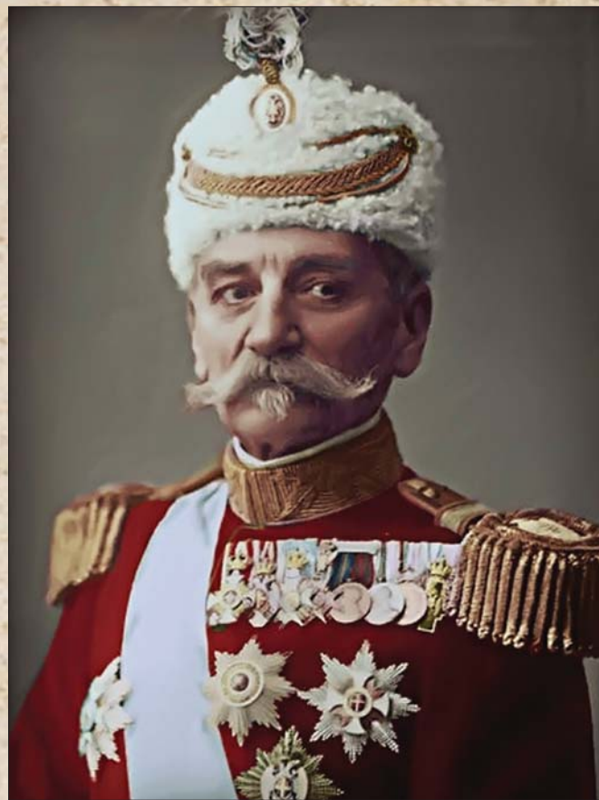
Краљ Петар у свечаној униформи

и са обе стране, ширитом (златним или сребрним) ширине 16 mm. Горе је метално (жуто или бело) испупчено дугме са узаном дугачком пантљиком, да би се нараменице утврдиле за мундир. Поље свечаних нараменица је од златне или сребрне тканине. Унутрашња попречна ширина круга је 90 mm, а уздужна 62 mm, спољна попречна ширина је 120 mm, а уздужна 90 mm. Ивица круга опточена је златним или сребрним оковом у виду полумесеца. Нараменице су одоздо постављене чојом боје испуске мундира која је