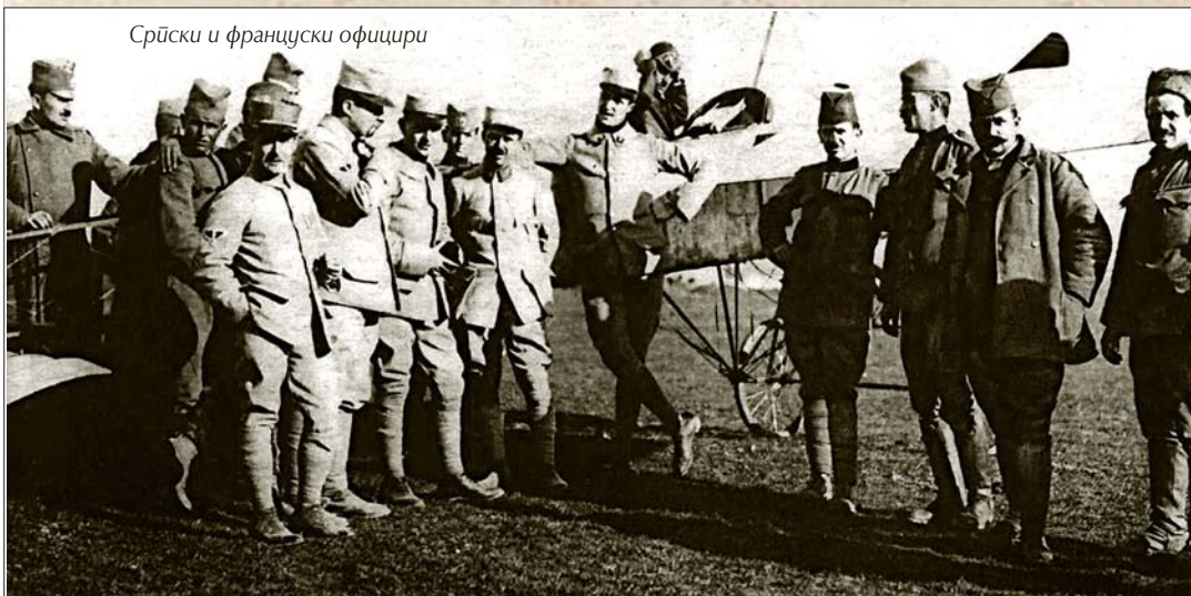
Српски и француски официри

Приликом уласка у Београд 1. новембра 1918. српска војска, коњица, Седми пешадијски пук и артиљерија, носили су француску плаву и „каки“ униформу и шлемове. Међутим, официри су највећим делом и даље имали униформу израђену по ранијем српском кроју, а сасвим мали број носио је француске или какве друге. Из Првог светског рата српска војска изашла је у много чему измењена. Иако ће се у новој епохи ослонац неизоставно тражити и у другачијим узорима, претходни облици одела као синоним „успешног оружја“ и „победничке војске“ биће основа будућем униформисању. ■