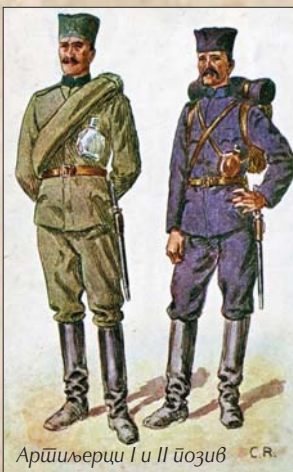
Артиљеријци I и II позив С.Р.