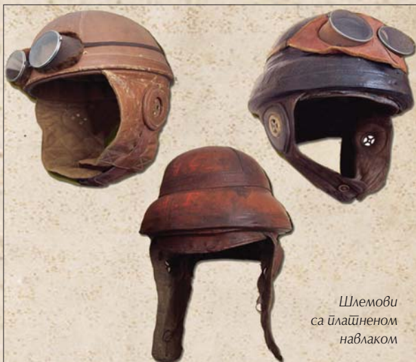
Шлемови са плашненим навлаком

Изузетак представља један једини до сада познати сачувани примерак српског шлема у боји „bleu horizon“, који се налази у једној приватној збирци. У ретким случајевима српске јединице опремане су и платненим навлакама за шлемове. Без обзира на чињеницу да је на Солунском фронту српској војсци подељено око 150.000 шлемова ти-