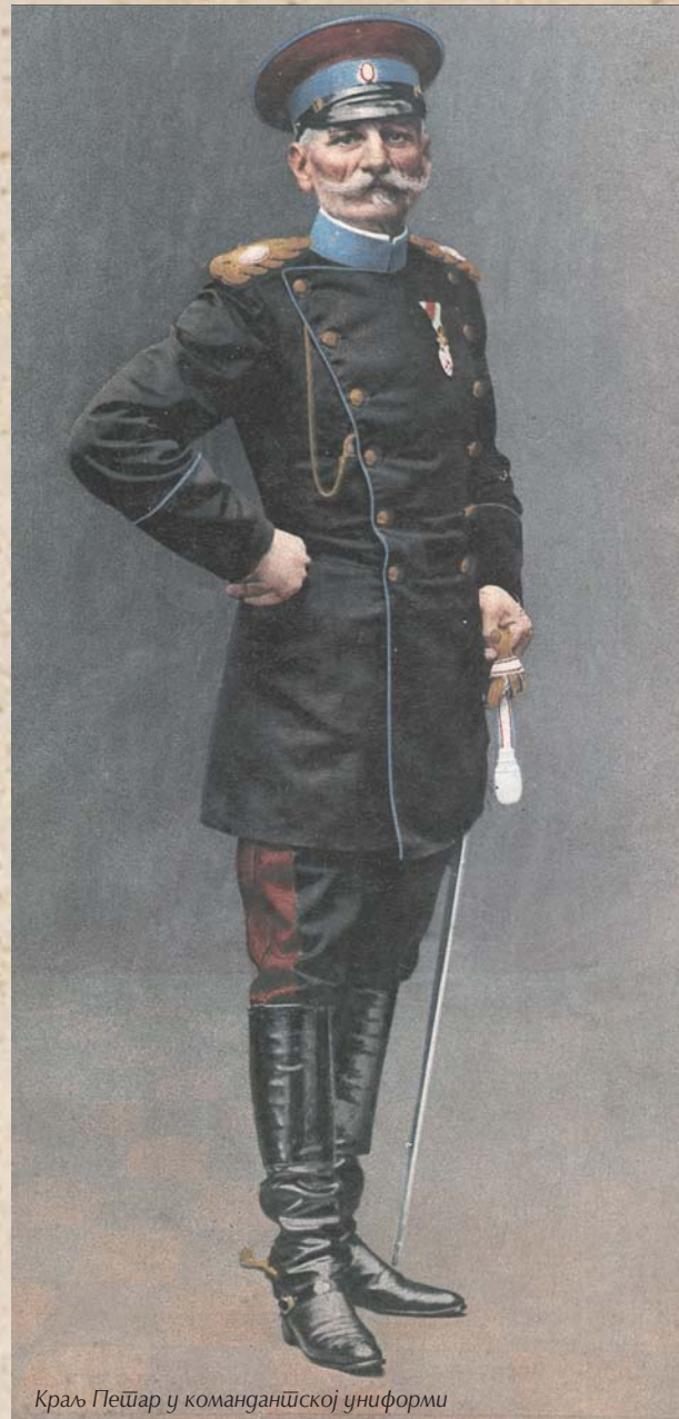
Краљ Пећар у командантској униформи

12 mm (жуто или бело) са узаном пантљиком, да би се нараменице утврдиле за мундир. На свакој нараменици су звезде које означавају чинове и то: пуковника и капетана друге класе по три, код капетана прве класе по четири, код потпуковника и поручника по две, а код мајора и потпоручника по једна. Две се ређају једна поред друге, три у купу са основом унутра, а четири унакрст. Звезде су златне на сребрним нараменицама, а златне на сребрним нараменицама. Официри по трупама на нараменицама носе бројеве својих трупа: у пешадији, коњички и пољској артиљерији (арапском цифром) свога пука; у брдској артиљерији римске бројеве свога пука; официри железничке чете носе железнички знак (точак са крилима), а остали видови инжињерије знаке по утврђеним цртежима. Бројеви и знаци су метални, пресовани, боје звезде. Дужина бројева је 25 mm. Нараменице за војводе и генерале су у облику плетеница, састављених у виду троструког златног гајтана дебљине 10 mm. Плетеница је одоздо постављена отворено