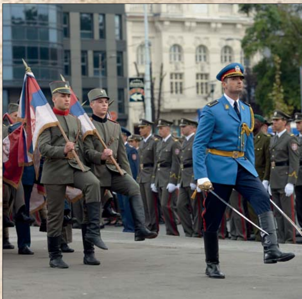
Некаг и саг

ну униформу као и коњица али другачије боје. Калпак је био сличан коњичком. Пешадијска атила је била голубије боје, а гајтани су били црни, док је код коњице још од 1859. године била тамнозелена са златним гајтанима. Чакшире су биле сличне коњичким, а чизме горе равне за разлику од коњичких које су биле хусарског кроја. Шињел гардиста био је боје атиле, а официри су носили шињел од беле руске чоје. Наоружање је било као у пешадији: српска брзометна пушка М. 99.