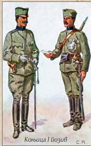
Коњица I позив С.Р.

(браон), код муницијских колона и покретне артиљеријске радионице латице и униформа као код артиљерије, код мостових тренова латице и униформа као и код инжењерије, а код свих осталих одељења, латице и униформа су као код пешадије.