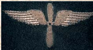
Дейшаљ- официрски знак