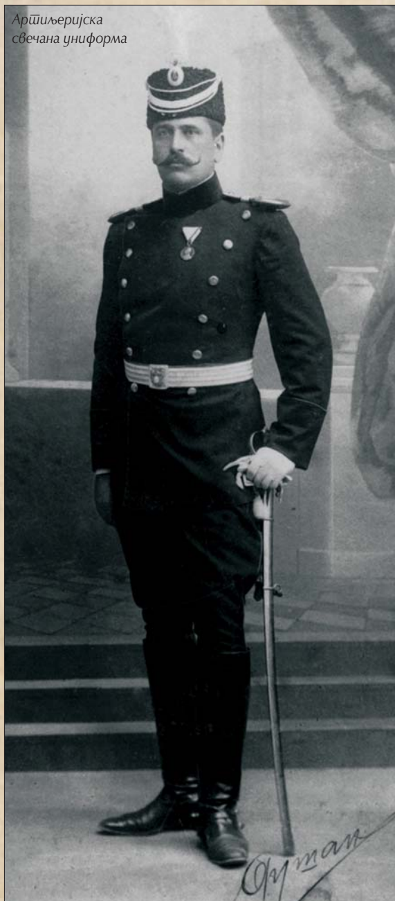
Артиљеријска свечана униформа

Појас (ешарпа) је од тробојне (црвено, плаво, бело) сребрне траке, ширине 45 mm, подељене на седам равних