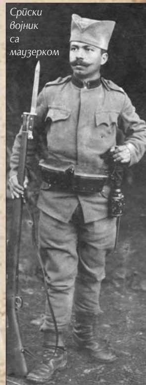
Српски војник са маузерком